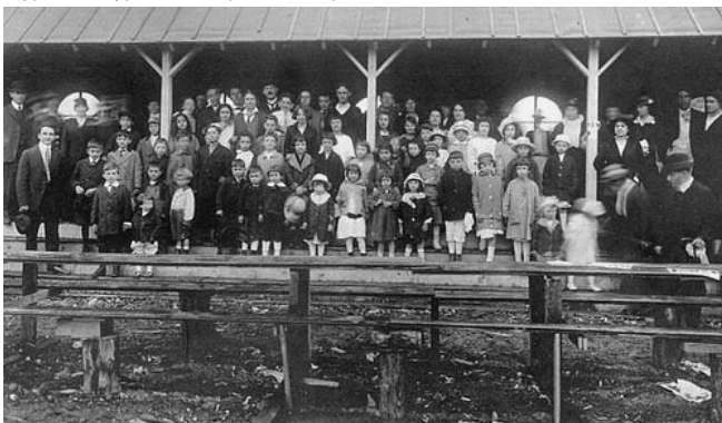
Η ημέρα της άφιξης: 16 Μαΐου 1915