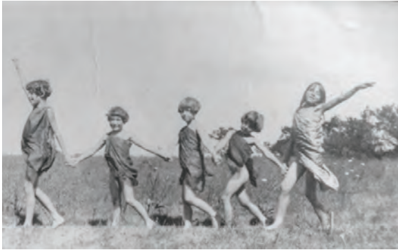
Ο χορός συνεχιζόταν ανέμελα και μετά το σχολείο (φωτ. του 1924-25)