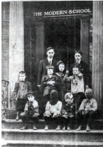
Το «Κέντρο Ferrer»