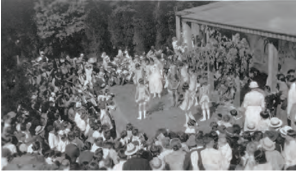
Θεατρική παράσταση για φίλους και συγγενείς το 1915

ταποθήκη που είχε μετατραπεί σε οικοτροφείο, ενώ παραδίπλα είχε χτιστεί ένας υπαίθριος κοιτώνας, που στέγαζε τριάντα παιδιά που είχαν μεταφερθεί από την πόλη. Όμως, οι συνθήκες διαβίωσης ήταν εξαιρετικά δύσκολες, καθώς τα οικονομικά προβλήματα ήταν πολλά και οι εγκαταστάσεις δεν είχαν ακόμη ολοκληρωθεί. Δυστυχώς, ήταν εκείνη την περίοδο που η κόρη της Margaret Sanger, Peggy, έπαθε πνευμονία και πέθανε σε νοσοκομείο στη Ν. Υόρκη.