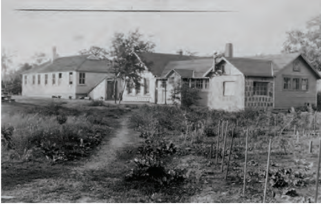
Οι σχολικές εγκαταστάσεις και τα εργαστήρια ολοκληρωμένα

Οι μαθητές, όπως επίσης και οι γονείς, συμμετείχαν στη διοίκηση του σχολείου, το οποίο αποτελούσε το στολίδι της κοινότητας, το κέντρο ενδιαφέροντος της ζωής της και τον κύριο λόγο ύπαρξής της. Η κοινότητα συγκέντρωνε μετανάστες και ντόπιους, διανοούμενους και εργάτες στον ίδιο βαθμό, ενώ δεν δίνονταν καμία σημασία στην καταγωγή και την προέλευση του καθενός. Επίσης, όλοι ήταν ιδιαίτερα προσεκτικοί όσον αφορά τις ελευθερίες των μελών στο ζήτημα της σεξουαλικής και φυλετικής ισότητας. Έτσι, πολλά ζευγάρια συζούσαν χωρίς να έχει προηγηθεί γάμος και τα παιδιά τα φρόντιζαν από κοινού.