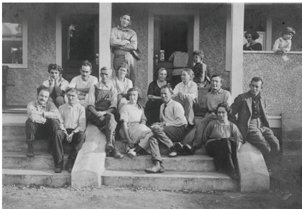
Το προσωπικό του σχολείου το 1920

πλήθος ανθρώπων. Είναι ώρα όλοι όσοι κοιπάζουν να αντιληφθούν ότι τα κοινωνικά συστήματα δεν αλλάζουν μέσα σε μία νύχτα. Και, καθώς κάθε νέα γενιά συνεχίζει την προηγούμενη, πρέπει να δοθεί περισσότερη προσοχή στα παιδιά, ειδικά, θα αφήσουν ανεκμετάλλευτα τα περισσότερα από αυτά που έφτιαξαν οι γονείς τους, όταν μεγαλώσουν και βγουν στον κόσμο».