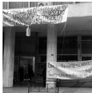
τα πανό της κατάληψης

23 Προβλήματα που καταδείχθηκαν, ένα χρόνο μετά, από την «επίσκεψη» στα γραφεία του TVXS στην οποία προχώρησαν μέλη της συνέλευσης που προέκυψε από την κατάληψη της ΕΣΗΕΑ, βλ. και http://katalipsiesiea.blogspot.com/2009/12/tvxsg.html