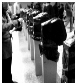
φώτο: κατεστραμμένα ακρωτικά της Αττικό Μετρό

Τα «ραντεβού στο δρόμο», από την άλλη, αρχίζουν να συγκεκριμενοποιούνται γύρω από τις πορείες των μαθητών και τα πανεκπαιδευτικά συλλαλητήρια, όπου «ο καθένας συμμετέχει όπως νομίζει». Αυτή η τακτική σεβόταν μεν την