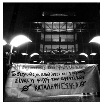
η παρέμβαση στα γραφεία του “Ελεύθερου Τύπου”