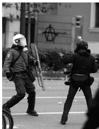
φωτογραφίες: ρεπόρτερς του Δεκέμβρη απέναντι στην αστυνομία