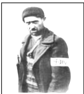
ΣΠΟΥΔΕΣ ΣΤΟ ΓΑΛΛΟΜΑΥΡΟ