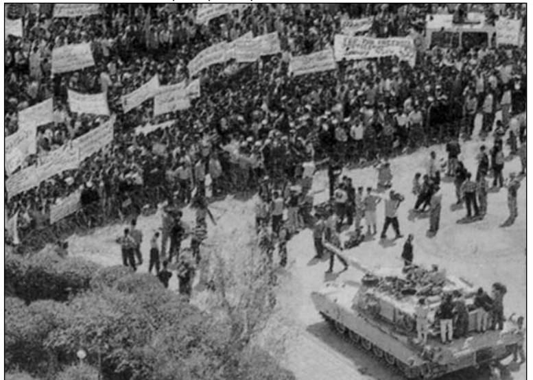
Διαδήλωση στο Ιράκ, κάπου στο 2006

Θα πρέπει τώρα να δούμε ακριβώς το πως εξελίσσονται τα εναντίον μας σχέδια. Και θα το κάνουμε ξεκινώντας από τον αντιμουσουλμανικό ρατσισμό, αυτή την κεντρική φασιστική ιδεολογία του 21ου αιώνα.