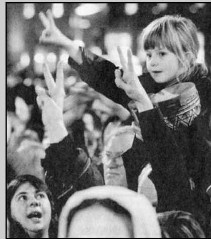
Ολλανδία 2005. Η κηδεία του ακροδεξιού Βαν Γκογκ μετατράπηκε σε ρατσιστική αντιμουσουλμανική διαδήλωση.

Σ' αυτές του τις περιπέτειες, το ελληνικό κράτος διαθέτει ένα συνηθισμένο για τα δεδομένα του πλεονέκτημα: Μια κοινωνία που αρέσκεται να πιστεύει πως τίποτα δεν τρέχει με τους μουσουλμάνους, το ρατσισμό, τους διακρατικούς ανταγωνισμούς και οτιδήποτε φαίνεται κομματάκι ακανθώδες ηθικά, ταξικά ή ανθρωπικά. Συνεπώς το μέλλον διαγράφεται λαμπρό.