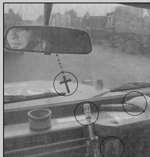
Σταυρουδάκι, παναγίτσα, πολυβόλο και το δάχτυλο στη σκανδάλη. Η Ελληνική συμμετοχή στην κατοχή του Αφγανιστάν συνεχίζεται.