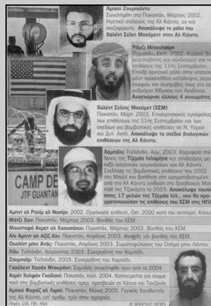
Στελέχη της Αλ Κάιντα από τον ημερήσιο τύπο. Ο πάνω πάνω είναι λέει "ηγετικό στέλεχος της Αλ Κάιντα, αν και σχιζοφρενής." Αυτό δεν τον εμπόδισε να καταδώσει όλους τους υπόλοιπους. Στο κάτω μέρος διαβάζουμε τις πηγές της αλήθειας: CIA, FBI, NSA.