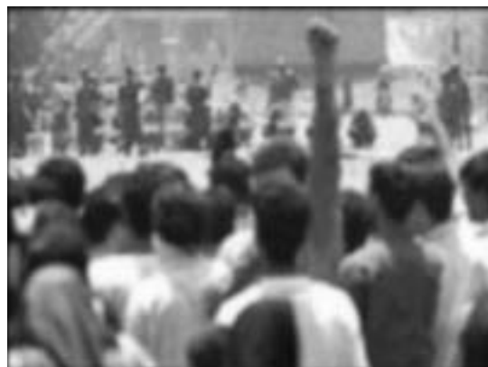
Ιράν, Ιούλιος 1999: Ιρανοί φοιτητές αντιμέτωποι με τις δυνάμεις ασφαλείας, σε μία από τις πολλές διαδηλώσεις που έγιναν στη χώρα και απαιτούσαν εκσυγχρονιστικές μεταρρυθμίσεις.

Ο ισλαμισμός στο Ιράν έπαιξε έναν διπλό ρόλο: έδωσε υποσχέσεις προστασίας στους προλετάριους από τα ξένα συμφέροντα, υποσχόμενο ταυτόχρονα στα ιρανικά αφεντικά ότι οι ιρανοί εργάτες θα μένουν ήσυχoi: ότι δεν θα απαιτούν, δεν θα κατηγορούν το καθεστώς για ψεύτικες υποσχέσεις ευημερίας, δεν θα διεκδικούν τη δίκαιη κατανομή του πλούτου των πετρελαίων, του πλούτου που οι ίδιοι παράγουν. Ο ισλαμισμός χρησιμοποιεί τον αντιαμερικανισμό που έχει μεγάλη κοινωνική βάση στην χώρα (εξαιτίας του πολέμου στο Ιράκ, της βάρβαρης και αιματηρής καταστολής του κράτους του Ισραήλ ενάντια στους Παλαιστίνιους), προκειμένου να προσδέσει τους ιρανοί προλετάριους στο σχέδιο επιθετικής συγκρότησης του ιρανικού κράτους σε περιφερειακή δύναμη στην περιοχή. Τι έχουν να κερδίσουν οι ιρανοί προλετάριοι από τα σχέδια αυτά; Το προφανές: να γίνουν κρέας για κανόνια.