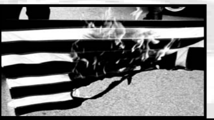
Για το νόημα της ημέρας του Πολυτεχνείου.

Η μνήμη, ωστόσο, είναι πολεμική και δεν υπάρχει ούτε αντικειμενική αλήθεια ούτε αναμφίβολα γεγονότα. Δεν υπάρχει ένα "Πολυτεχνείο", αλλά πολλά και κάποια κατασκευασμένα από το μηδέν. Ποιο λοιπόν είναι το Πολυτεχνείο που θυμόμαστε στις 17 Νοέμβρη;