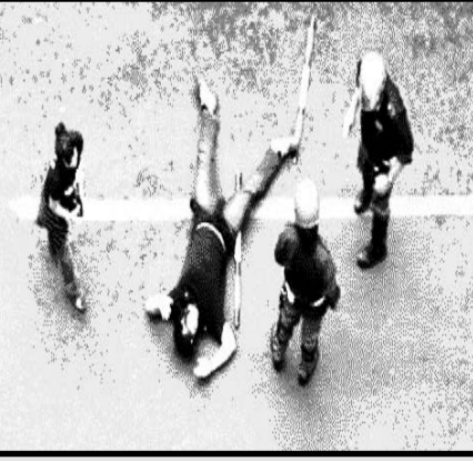
Φασίστας σε στιλ "πατημένη κατσαρίδα" στην όμορφη Ιταλία.